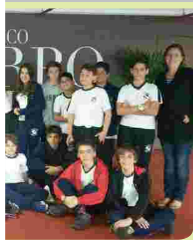
Em maio, os alunos do 8º ano visitaram a exposição "O fantástico corpo humano", na qual puderam observar corpos e órgãos reais.