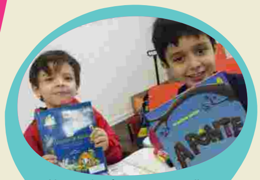
Alunos do 2º ano mostram livros trabalhados no projeto