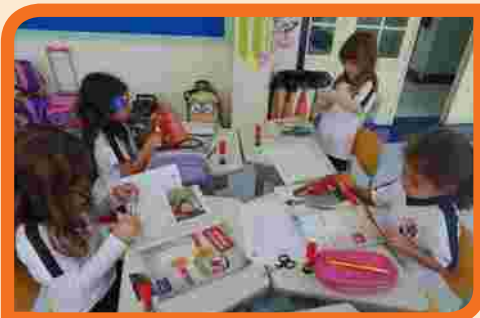
Para aprender sobre o consumo consciente, alunas procuram em revistas produtos que podem ser comprados.

O Colégio Santo Ivo decidiu trabalhar com os alunos da Educação