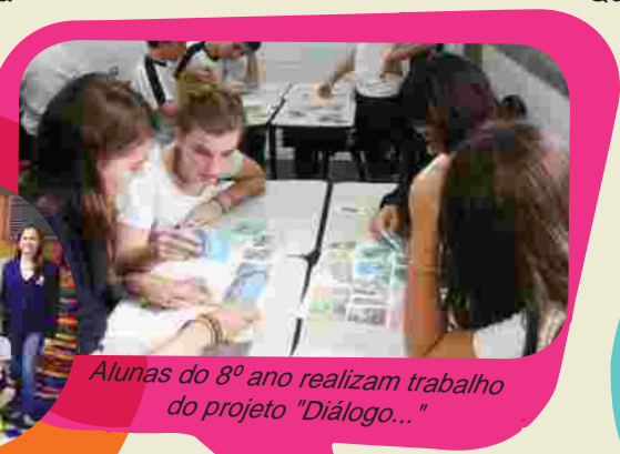
Alunas do 8º ano realizam trabalho do projeto "Diálogo..."